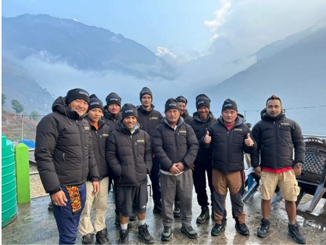
Porters in Nepal met door Sawadee gedoneerde uitrusting

geproduceerde souvenirs te kopen. Op het moment zijn veel van deze factoren voor Sawadee nog niet meetbaar.