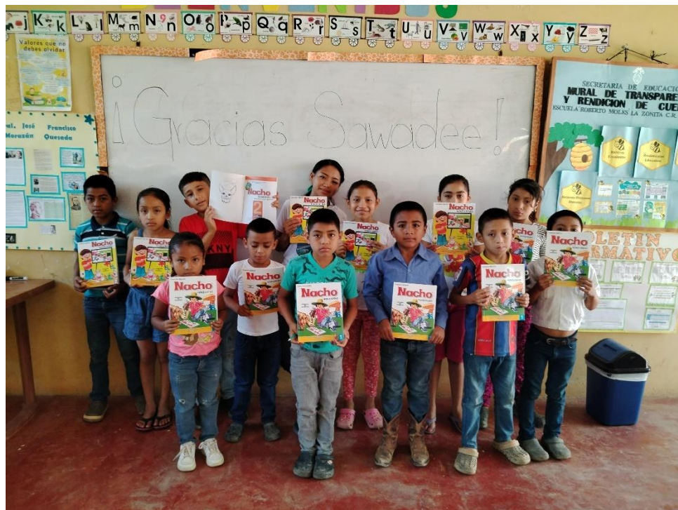
Leerlingen in Honduras met schoolboeken gedoneerd door Sawadee reizigers

Zoals in de Climate Action Plan omschreven zijn er een aantal projecten die voor langere tijd doorlopen. Een daarvan zijn Puur Sawadee projecten en Accommodaties. Deze term wordt sinds 2010 gebruikt. In 2022 en 2023 hebben we verschillende puur Sawadee projecten en accommodaties op onze reizen toegevoegd. Daarmee hebben we ook de positieve impact kunnen vergroten. Daarbij komt dat we meerdere van deze projecten een financiële ondersteuning hebben kunnen geven. Bijvoorbeeld door met de vrijwillige bijdrage van reizigers schoolboeken te kopen voor basisschool leerlingen in Honduras ( link ).