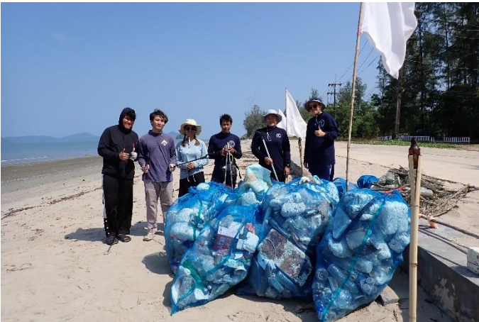
Strand schoonmaak door Andaman Coastal Research Station for Development in Thailand

In 2023 deden we een analyse om te kijken hoeveel van de accommodaties die Sawadee aanbiedt, aantoonbare stappen zet op gebied van duurzaamheid. Hieruit bleek dat 44% van de accommodaties aan minstens 10 criteria voldeed. Zes procent van alle accommodaties waren campings en homestay's die een minimale CO 2 -uitstoot hebben, en juist veel sociale voordelen brengen. Deze overnachtingen werden daarom automatisch als 'neemt stappen op gebied van duurzaamheid' aangemerkt. In 2024 is het doel om te verhogen naar 60% van het totale aanbod.